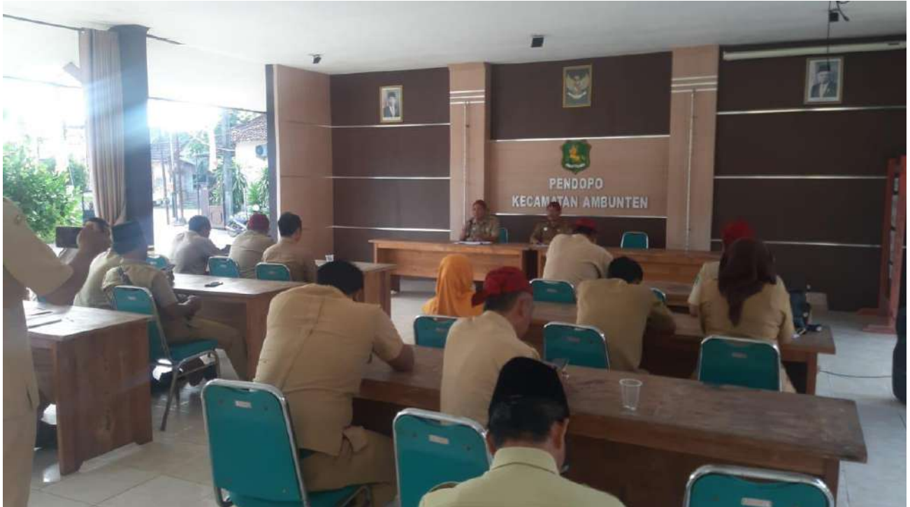
FOTO DOKUMENTASI PEMBAHASAN RANCANGAN RENCANA KERJA PERANGKAT DAERAH TAHUN 2024 KECAMATAN AMBUNTEN KABUPATEN SUMENEP PADA HARI SENIN, TANGGAL 24 JULI 2023